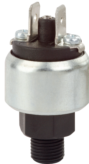
Kompaktowy przełącznik ciśnienia OEM, format miniaturowy, model PSM04