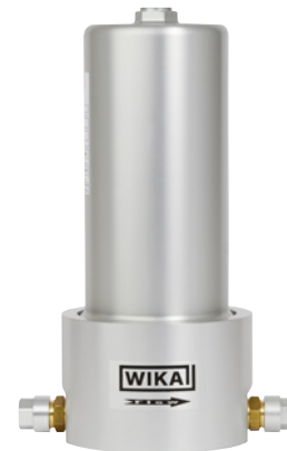
Unità filtro portatile SF 6 , modello GPF-10

L'unità filtro viene installata per proteggere l'attrezzatura di service (p.e. unità di trasferimento o pompa di aspirazione) da particelle, umidità e prodotti di decomposizione. Dopo la filtrazione, nel migliore dei casi il gas SF 6 può essere riutilizzato.