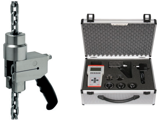
Kettenzugprüfset, Typ FRKPS