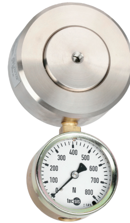
Гидравлический преобразователь силы сжатия, модель F1115